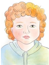
Ben, 5 years old, USA